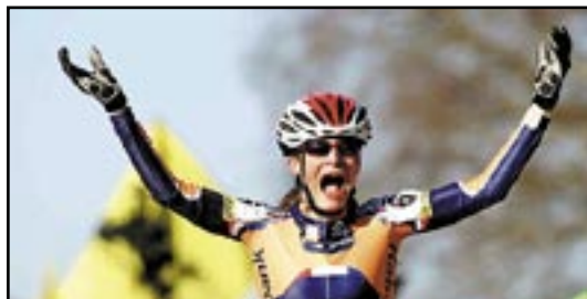
De 18-jarige wereldkampioene veldrijden Marianne Vos.

ZEDDAM - Het gaat 'r om truien en titels. Wielrennen, veldrijden, mountainbiken of marathonschaatsen: het is Marianne gelijk.